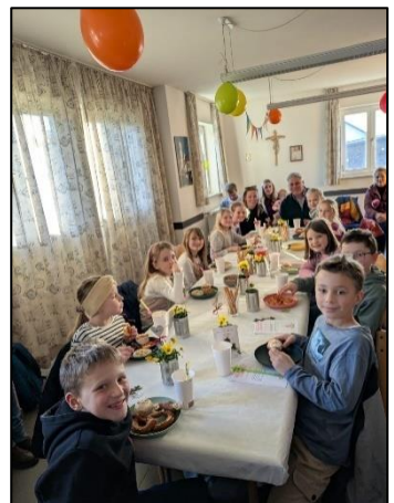
(Text und Foto: Verena Lang)

Als kleines Highlight durfte jedes Kind eine christliche Affirmationskarte und eine Blume mit nach Hause nehmen – als Erinnerung an einen besonderen Tag, der sicher noch lange im Herzen bleibt.